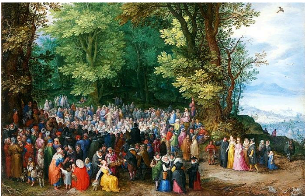
Jan Brueghel de Oudere, Bergrede, 1598

Deze menigte volgt Jezus ook. In eerste instantie gebeurt dat in Galilea, maar ook onderweg naar Jeruzalem en in Jeruzalem wordt Jezus vaak omringd door een menigte mensen.