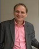
Van de Dominee